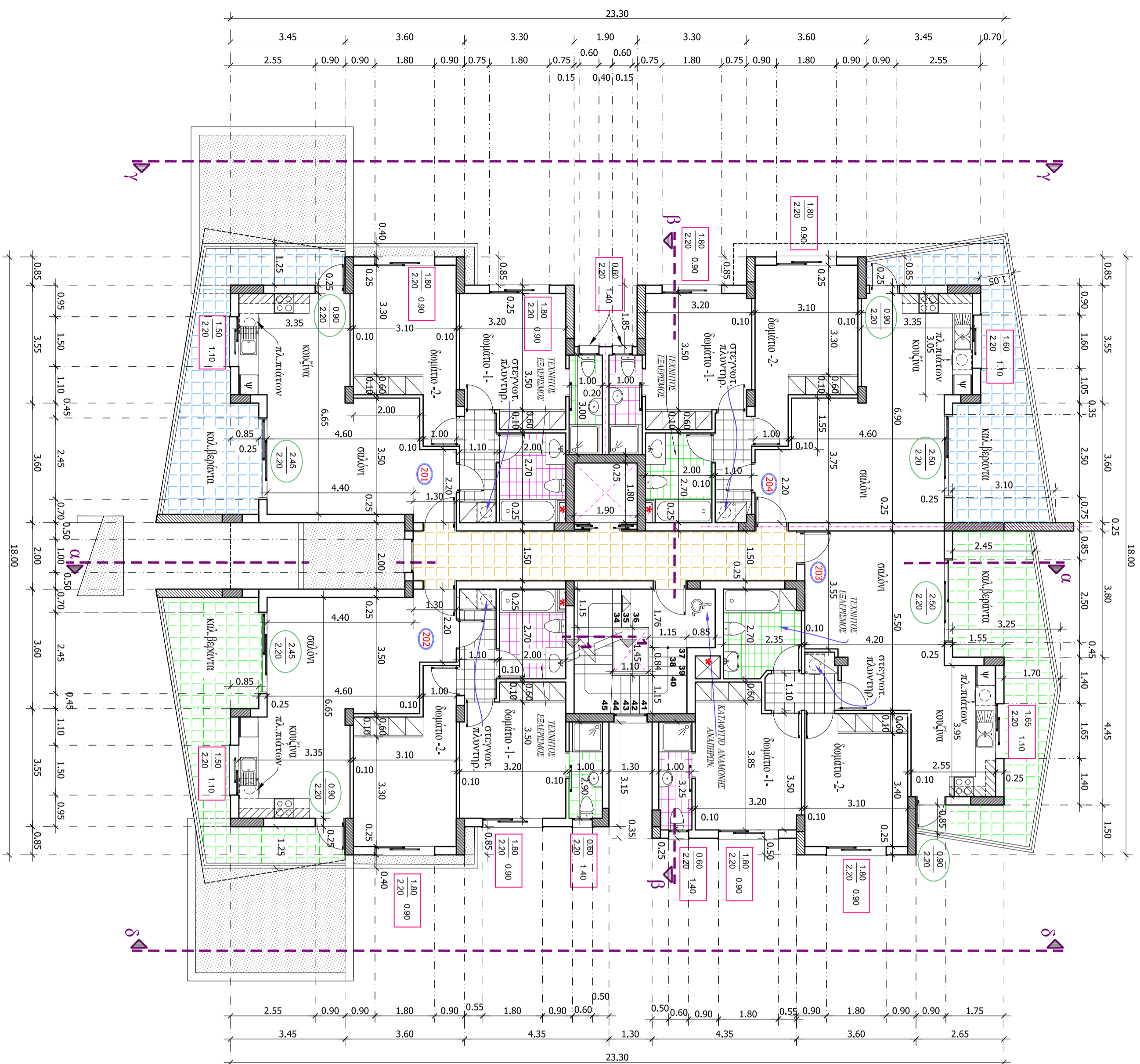
Κάρτη 1ου ορόφου.